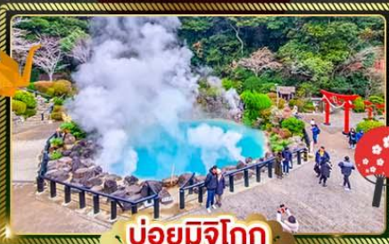
บ่อน้ำพุร้อนคิอูชู