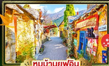
หมู่บ้านยฟูอิน