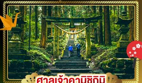
ศาลเจ้าคามิชิมิ