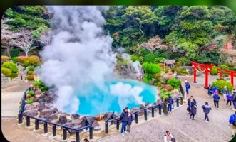
บ่อยูมิจิโกกุ

FUKUOKA AREA หรือเทียบเท่ามาตรฐานญี่ปุ่น