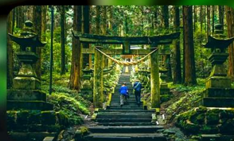
ศาลเจ้าคามิชิกิมิ