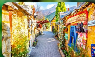
หมู่บ้านยูฟุอิน